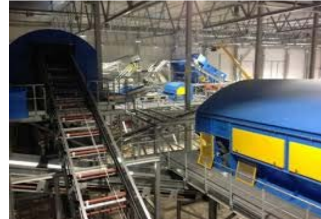
ROAFs sorteringsanlegg på Romerike